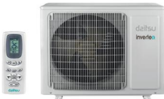
Campo di funzionamento