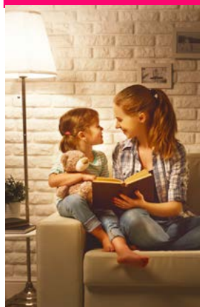
Asistencia Luz 360 Plus