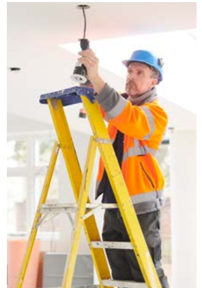
Asistencia Protección Hogar Plan 3

Nuestros asesores especializados te acompañarán en todo el proceso de tu afiliación.