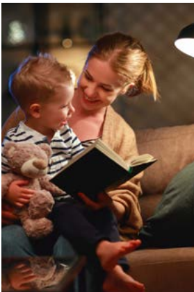
Asistencia Luz 360