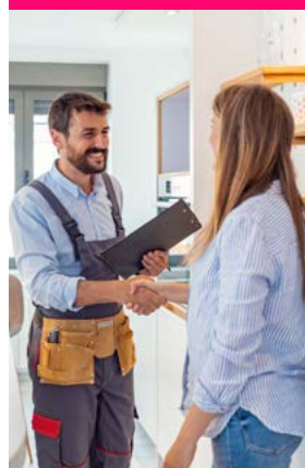
Asistencia Protección Hogar Plan 2