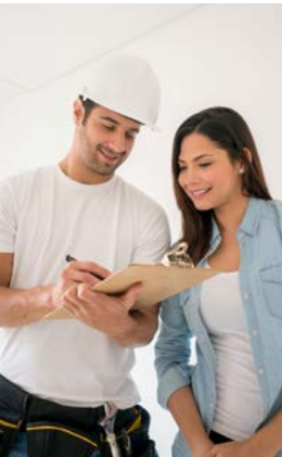
Asistencia Protección Hogar Plan 1