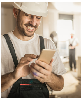
Asistencia Protección Hogar