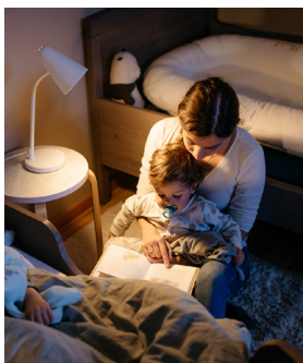
Asistencia Luz 360