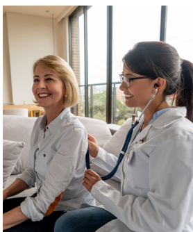
Asistencia Doctor 360