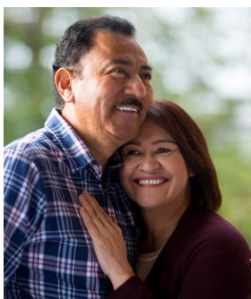
Asistencia Funeral 360